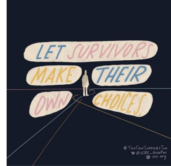
الشكل 1:

يرجع أصل مصطلح «التركيز على الناجيات» إلى عمل الناشطات بحقوق المرأة، اللواتي يوفرن الدعم والخدمات للنساء اللاتي يتعرضن للعنف الجنسي وعنف الشريك الحميم. 2 وأصبح اليوم مصطلحًا شائعًا يستخدم عالميًا في سياق تقديم الخدمات ضد العنف القائم على النوع الاجتماعي. يصف مصطلح التركيز على الناجيات نهجًا داعمًا ومتعاطفًا للعمل مع ناجية من العنف القائم على النوع الاجتماعي، مع التركيز على سلامتها وتعزيز قدراتها الشخصية وسلطانها الداخلية وسلطانها لأجل خلق تغيير. ويستوحى النهج الذي يركز على الناجيات من النظريات والممارسات النسوية وتلك المرتكزة على العمل الاجتماعي والملمة بتأثير الصدمات. 3 وهي عملية مساعدة هدفها علاجي في المقام الأول، ويتم ذلك بالسعي وراء تسهيل العلاج والشفاء. وهدفها الثاني سياسي بالسعي لتدارك الأنظمة الأبوية، والأعراف والممارسات التي تسبب أشكال العنف القائم على النوع الاجتماعي الشخصي والنظامي. 4 تترايط هذه الأهداف العلاجية والسياسية وتعمل بالتوازي كمقدمة للخدمات تعمل مع الناجيات.