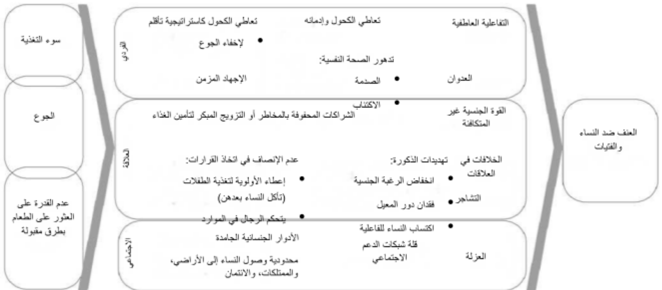
انعدام الأمن الغذائي

https://www.womensrefugeecommission.org/research-resources/our-voices-our-future-understanding-risks-and-adaptive-capacities-to-prevent-and-respond-to-child-marriage-in-the-bangsamoro-autonomous-region-in-muslim-mindanao-barmm