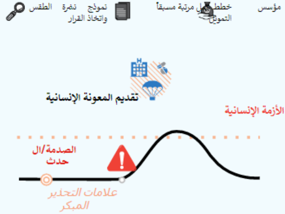
الشكل 3. الاستجابة التقليدية ضد الاستجابة الاستباقية

الصندوق المركزي للاستجابة للطوارئ، التابع للأمم المتحدة، هو الآلية الرئيسية للإفراج السريع عن التمويل لحالات الطوارئ الإنسانية، أمراً تجريبياً في العديد من الأوضاع الإنسانية على مستوى العالم. كما أعاد برنامج الصندوق المركزي للاستجابة للطوارئ، مؤخراً، النظر في "المعايير المنقذة للحياة" لتشمل المزيد من مكونات الاستجابة للعنف القائم على النوع الاجتماعي. وهذا يعني أنه أكثر من أي وقت مضى (على الرغم من أنه لا يزال غير موجود في جميع الحالات)، يمكن استخدام تمويل الصندوق المركزي لمواجهة الطوارئ في إطار الإجراءات الاستباقية وبالتالي لضمان الحصول على خدمات خصوصية تخص العنف القائم على النوع الاجتماعي، والتي تركز على الناجيات للنساء والفتيات وإرساء الحماية وآليات الوقاية من العنف القائم على النوع الاجتماعي. 198