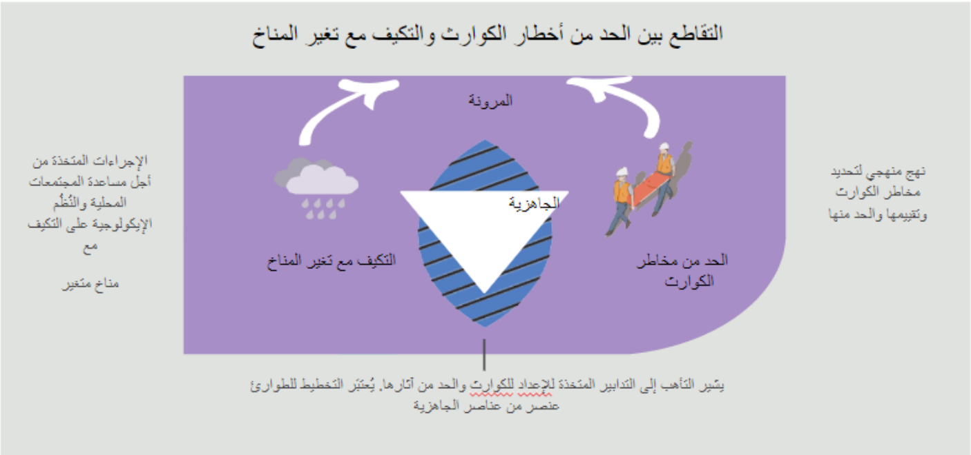
الشكل 2. التقاطع بين الحد من أخطار الكوارث والتكيف مع تغير المناخ

الشكل 2. التقاطع بين الحد من الكوارث والتكيف مع تغير المناخ 182